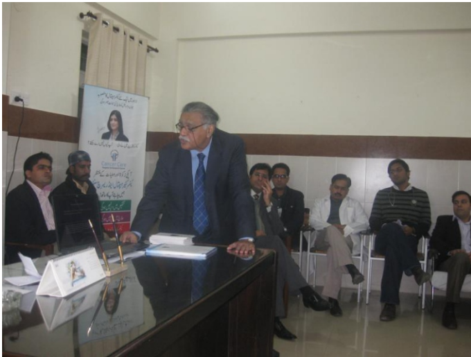
سرمرز اسٹیوٹ آف میڈیکل سائنسز (SIMS) میں میڈیکل آفیسرز اور ہاؤس آفیسرز کے لئے Palliative Care پر ایک لیکچر منعقد کیا گیا۔