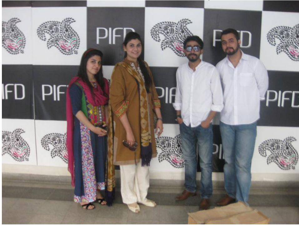
پاکستان انسٹیٹیوٹ آف فیشن اینڈ ڈیزائن میں فنڈ ریزنگ