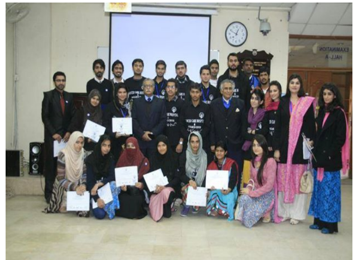
ہیلی کالج آف بینکنگ اور فائننس میں کینسر کی آگہی پر سیمینار کیا گیا