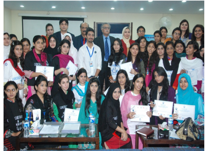
لاہور کالج فار وٹین یونیورسٹی ڈیپارٹمنٹ آف بائیو ٹیکنالوجی میں "Awareness of emerging issues of cancer in Pakistan" پر H.E.C سے فنڈ ڈائیک ورکشاپ کا اہتمام کیا گیا۔