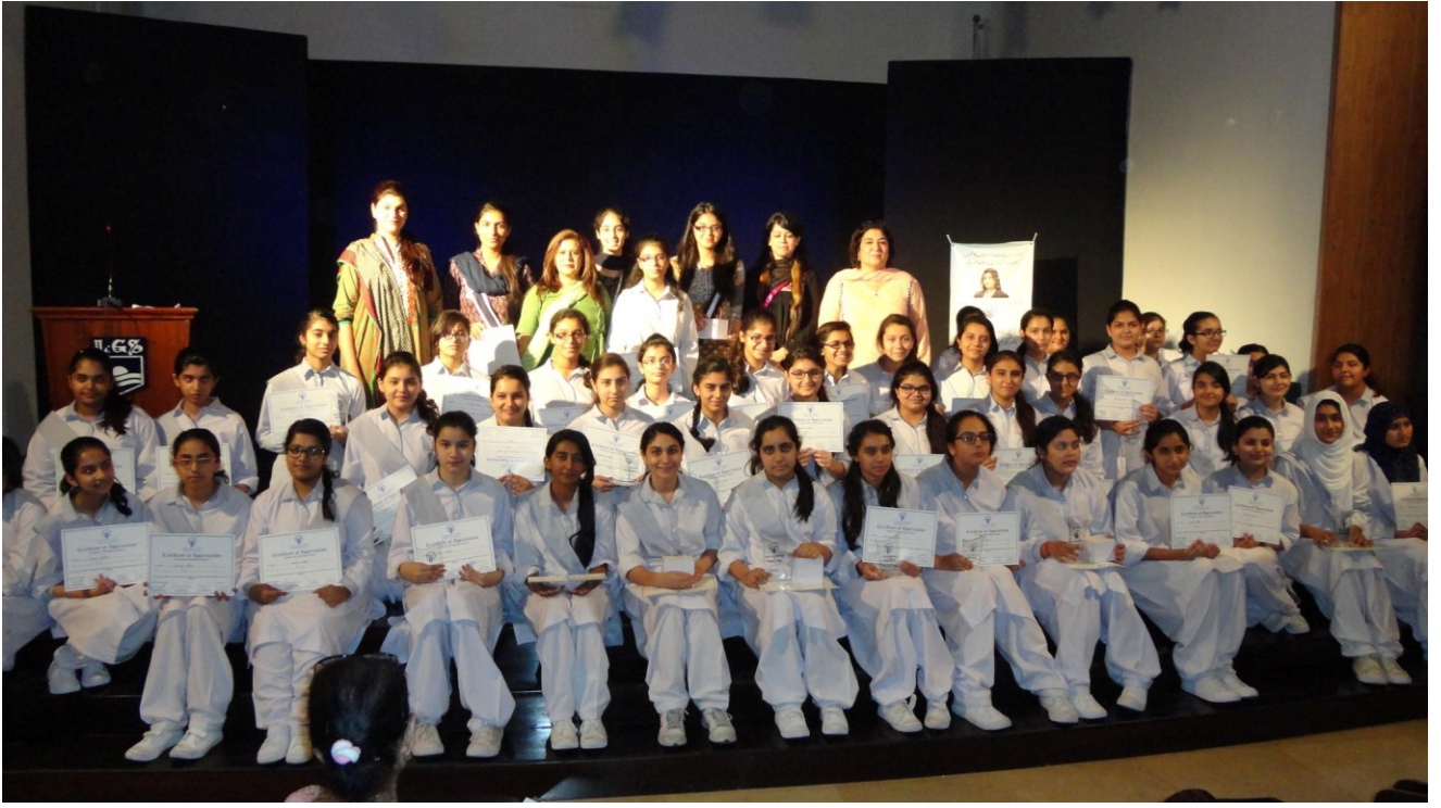
لاہور گرائمر سکول 1A1 غالب مارکیٹ برانچ میں فنڈ ریزنگ کرنے والے طالب علموں کی حوصلہ افزائی کے لئے شیلڈز اور سرٹیفیکیٹ دئے گئے