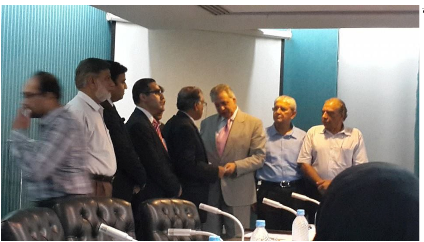
لاہور چیمبر آف کامرس میں پریزیڈنٹ ڈاکٹر شہریار CSR کا چیک لیتے ہوئے۔