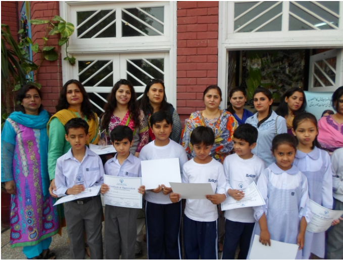
لاہور گرائمر سکول واپڈاٹاؤن میں فنڈ ریزنگ