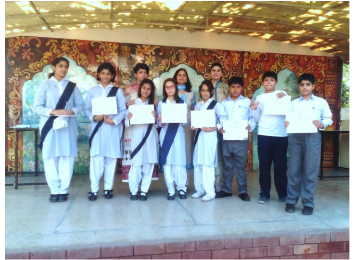
لاہور گرائمر سکول عارف جان روڈ میں فنڈ ریزنگ