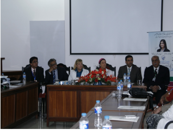
یونیورسٹی آف ہیلتھ سائنسز میں سیمینار