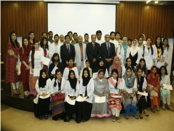
یونیورسٹی کالج آف لاہور کے ڈپارٹمنٹ، میڈیکل اینڈ ڈسٹنسری (UMDC) میں کینسر سے بچاؤ اور صحت مندانہ زندگی کی آگہی پر سیمینار