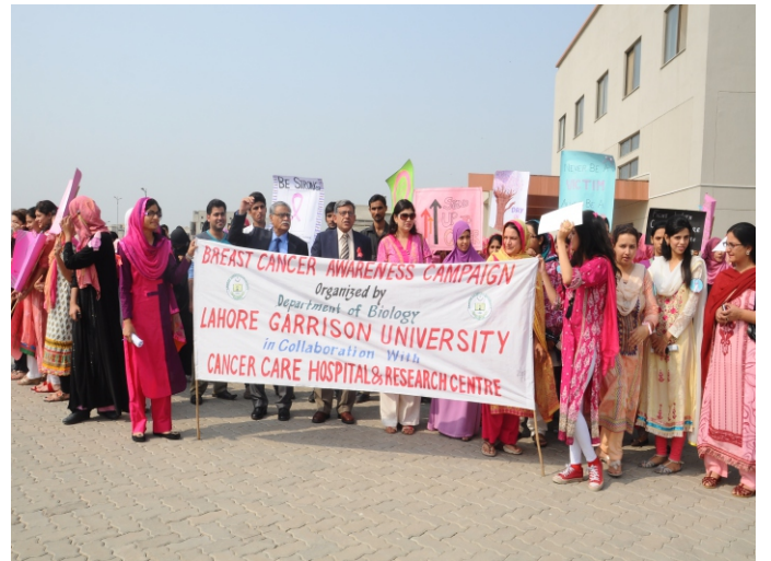
گیریشن یونیورسٹی میں بریسٹ کینسر پریسینار اور Walk