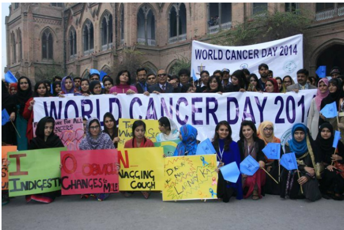
گورنمنٹ کالج یونیورسٹی میں ورلڈ کینسر ڈے پر Walk اور سیمینار کا اہتمام کیا گیا