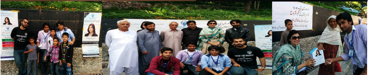
مری تحصیل میونسپل ایسوسی ایشن (TMA) میں Presentation اور مری مال روڈ پرنسٹن ریزنگ