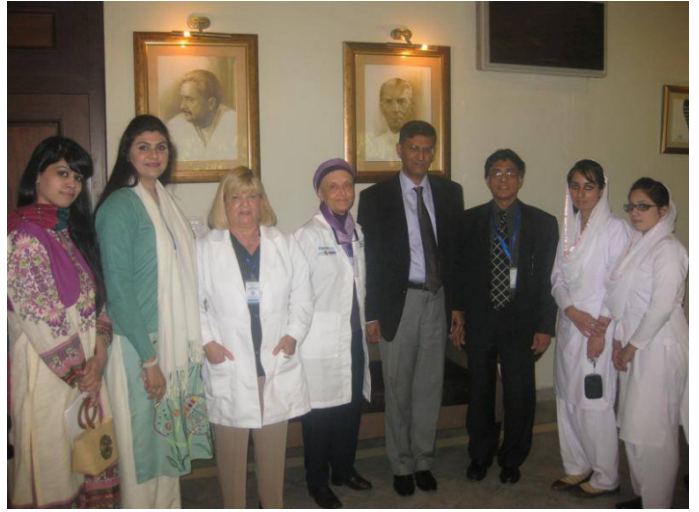
جناح ہسپتال میں ڈاکٹر ز اور نرسز کی on site ٹریننگ