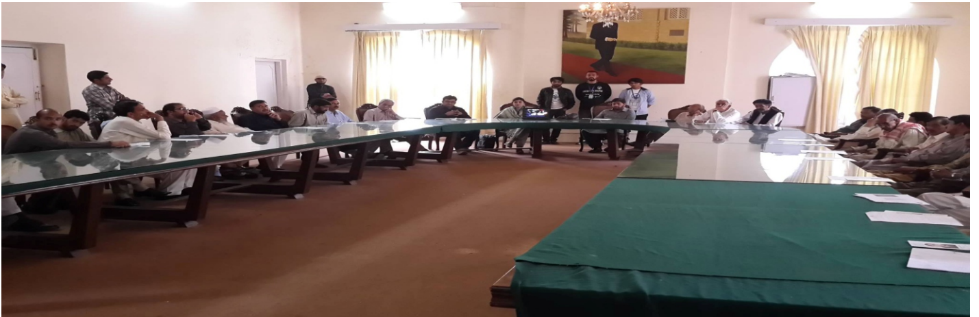
ٹیک سوسائٹی لاہور میں Cancer Awareness پروگرام