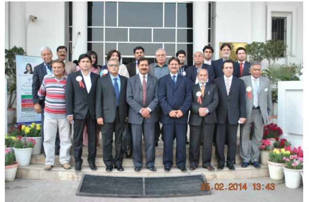
سیالکوٹ چیمبر آف کامرس میں Lung Cancer پر سیمینار اور فنڈ ریزنگ