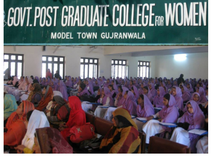
گوجرانوالہ گرلز ڈگری کالج میں کینسر سے آگہی پر سیمینار