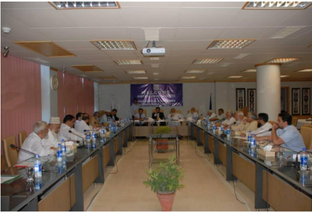
فیصل آباد چیمبر آف کامرس میں فنڈ ریزنگ اور کینسر سے آگہی۔