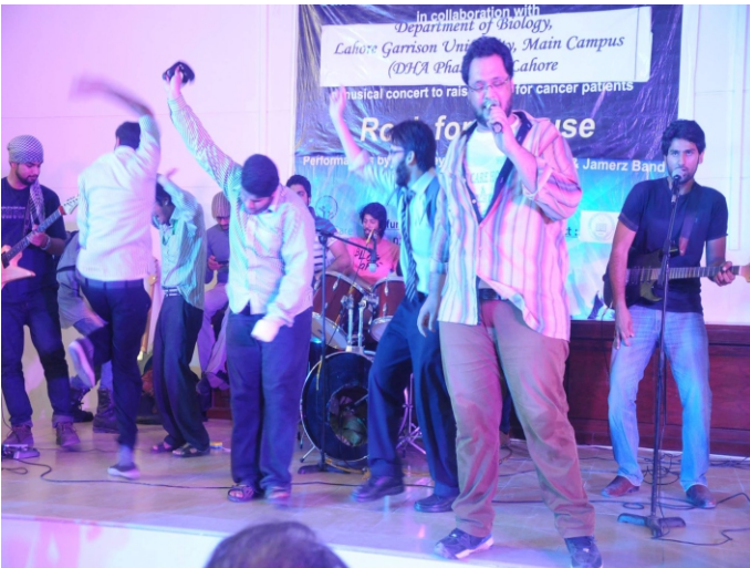
گیریشن یونیورسٹی میں فنڈ ریزنگ میوزیکل Concert