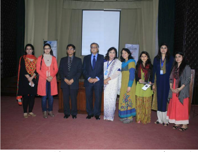
کنیئر ڈکالچ لاہور میں کینسر سے بچاؤ اور صحت مندانہ زندگی گزارنے پر سیمینار