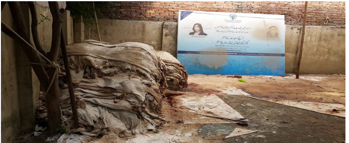
عید الاضحیٰ پر قربانی کی کھالیں۔